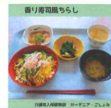
香り寿司風ちらし