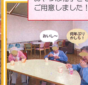
おいし〜 何年ぶりかしら！

12月おやつレク 『カップ麺』4種類のプタ メンからお好みの味を一つ 選び、熱々のラーメンをす ずって食べました！